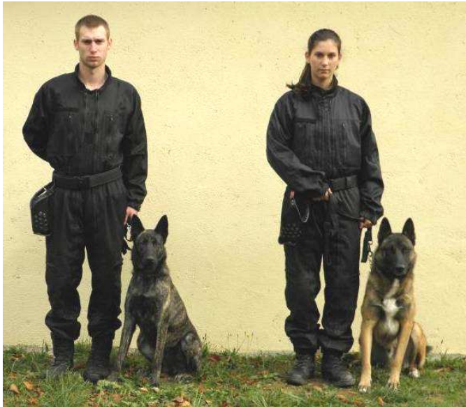
Box à disposition pour chaque chien de stagiaire